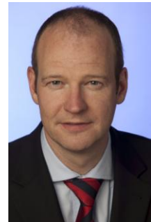
RA Arnold informiert: