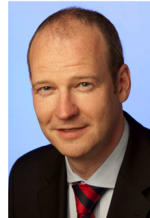
RA Arnold informiert: